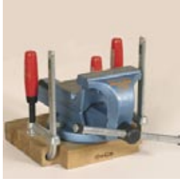
Schraubzwingen nach oben gedreht und festgespannt - für Aufbewahrung und Transport

Spannunterlage 40 mm, Buche massiv. Oberfläche geschliffen und imprägniert. Ganzstahl-Rundbügelzwingen, Spannweite 150/90mm, unverlierbar und drehbar. Ausklinkung ermöglicht einwandfreies Spannen von Werkstücken.