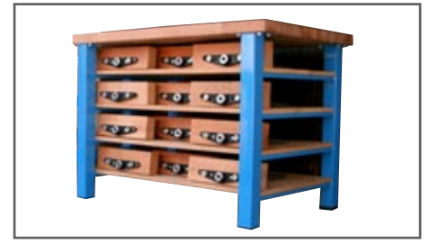
Fachböden mit Spannzangen