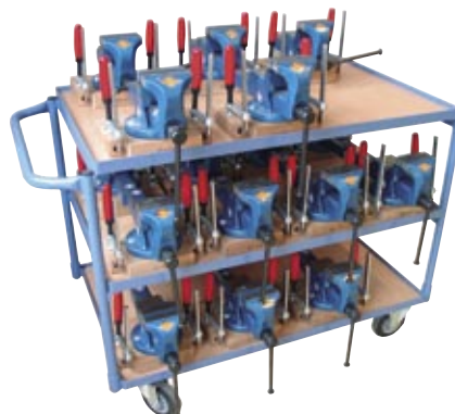
Schraubstockwagen mit Parallelschraubstöcken