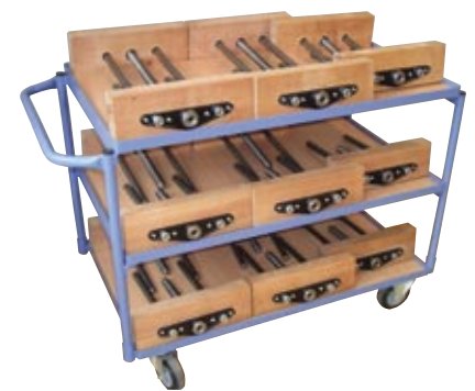
Spannzangenwagen mit 16 Spannzangen