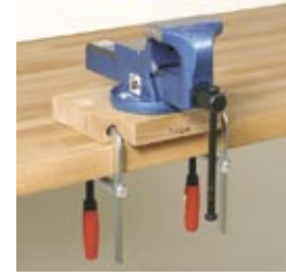
Schraubzwingen unten Befestigung am Arbeitsplatz