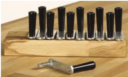
Werkzeugblock für Spannkurbel und Bankhaken