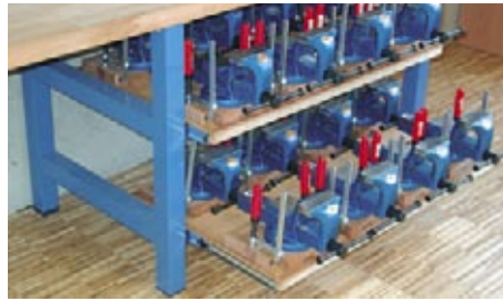
Fachbodenauszug für Parallelschraubstöcke