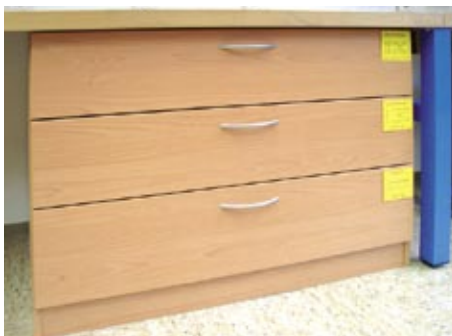
Unterbauschrank für Arbeitsvorrichtungen