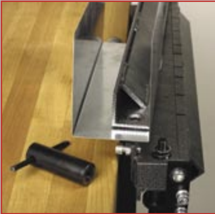
Entnahme geschlossener Profile oder U-Profile

Schneiden, Biegen; Rundbiegen und Richten