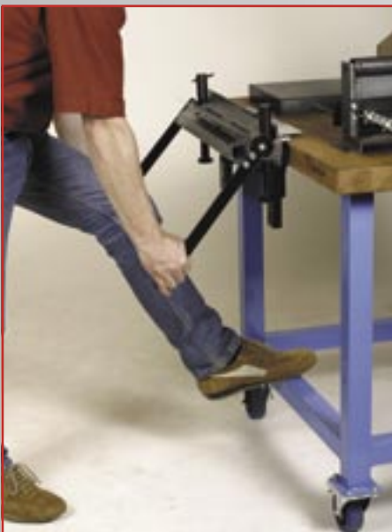
Kraftsparendes Biegen durch Aufstellen des Fußes an der tief angebrachten Verstrebung