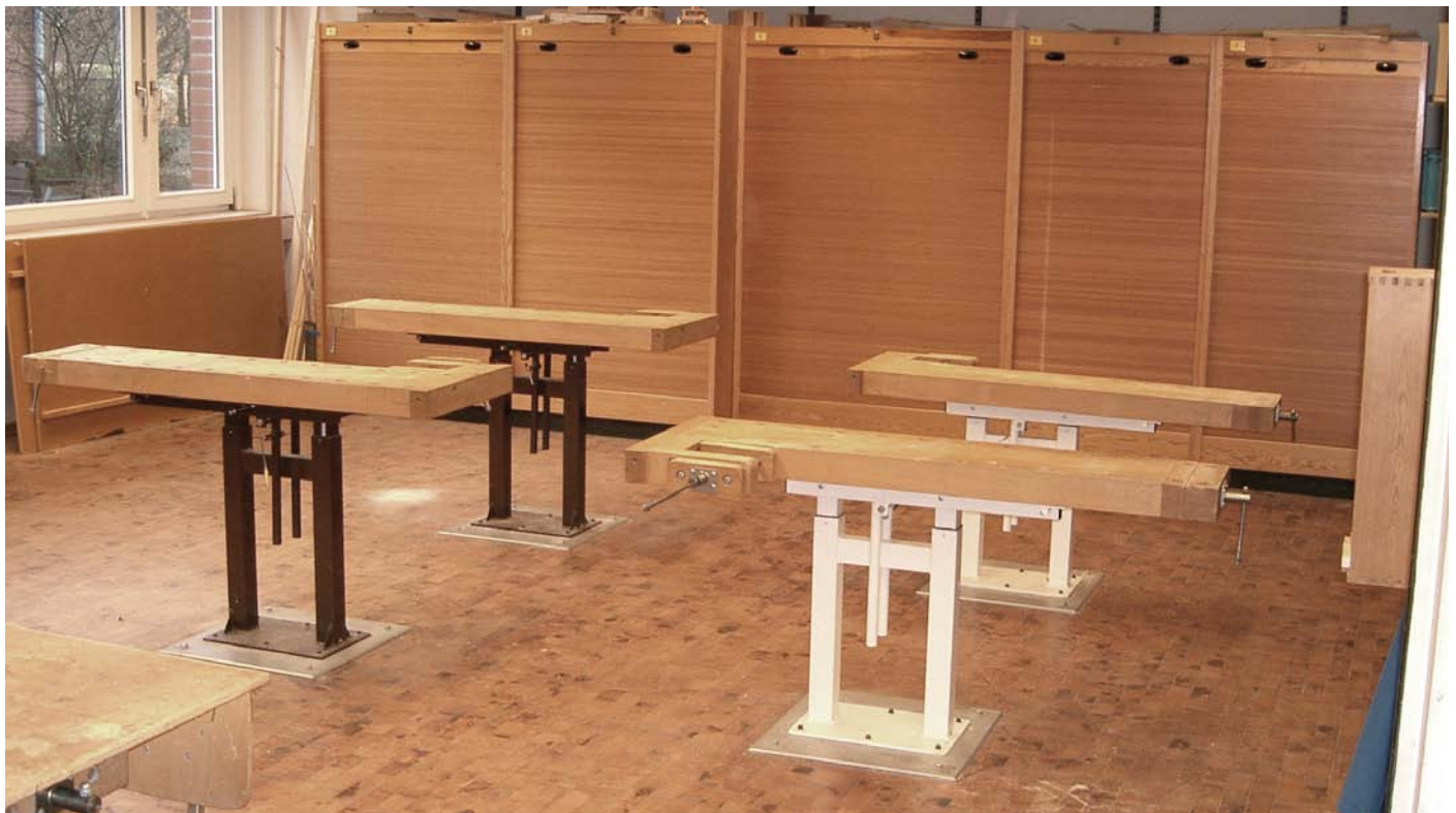
Werkraum der Werner-Dicke-Schule im Annatift Hannover „mit Säulenwerkbankgruppe“

Werkraum mit Lervad-Säulenwerkbenke, höhen- und neigungsverstellbar (Best.Nr. 10586), 3 Stück mit rechter und 1 Stück mit linker Seitenzange und praktischen Rollladenschränken.