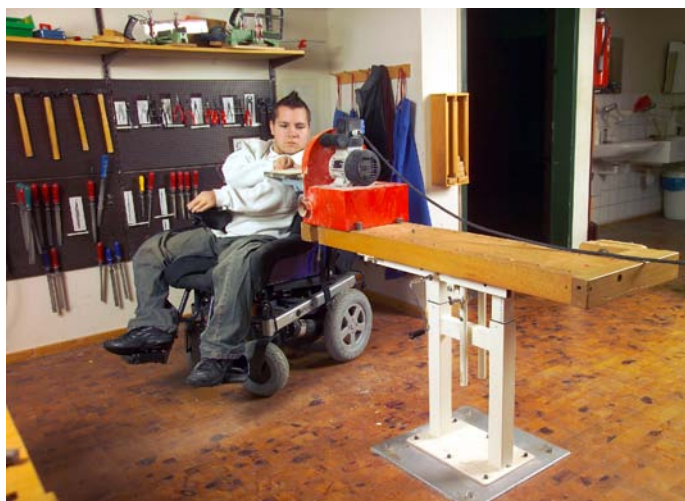
Arbeiten an der Tellerschleifmaschine